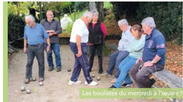
Les boulistes du mercredi à l'œuvre !!