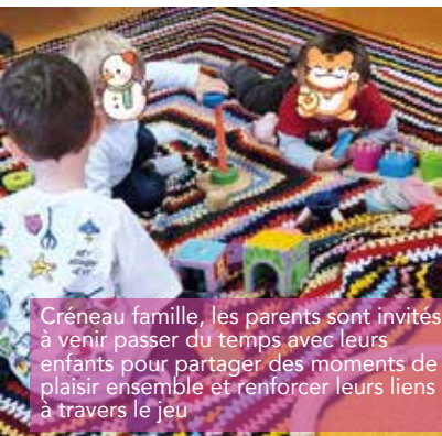
Créneau famille, les parents sont invités à venir passer du temps avec leurs enfants pour partager des moments de plaisir ensemble et renforcer leurs liens à travers le jeu