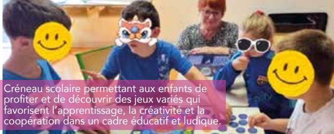
Créneau scolaire permettant aux enfants de profiter et de découvrir des jeux variés qui favorisent l'apprentissage, la créativité et la coopération dans un cadre éducatif et ludique.