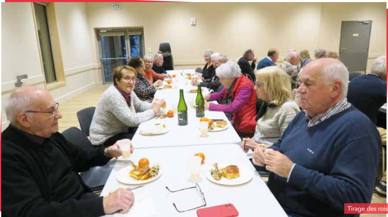
Tirage des rois

Merci à toutes les personnes qui participent à nos manifestations. Vous souhaitant ainsi qu'à votre famille, bonne et heureuse année 2025.