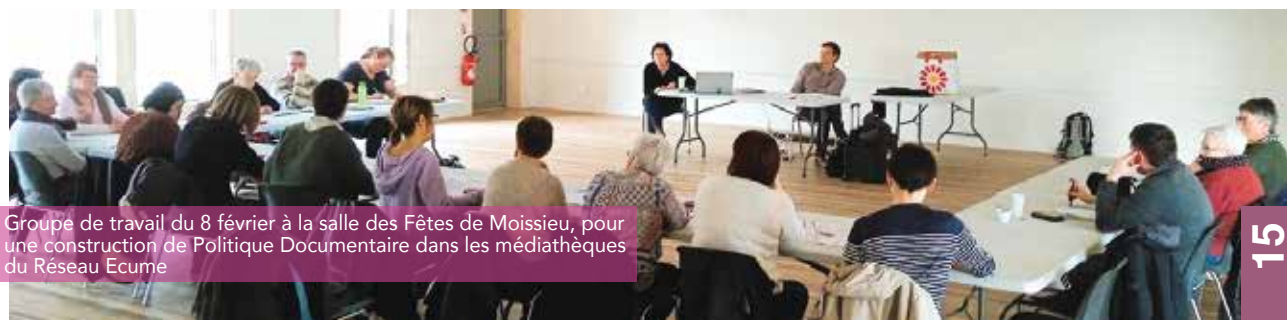
Groupe de travail du 8 février à la salle des Fêtes de Moissieu, pour une construction de Politique Documentaire dans les médiathèques du Réseau Ecume