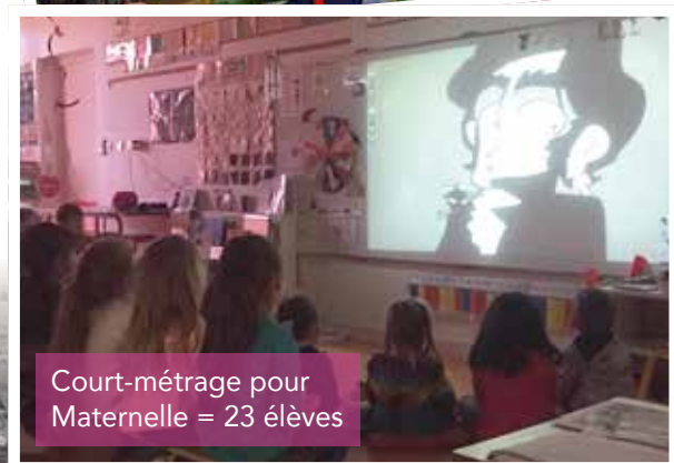
Court-métrage pour Maternelle = 23 élèves