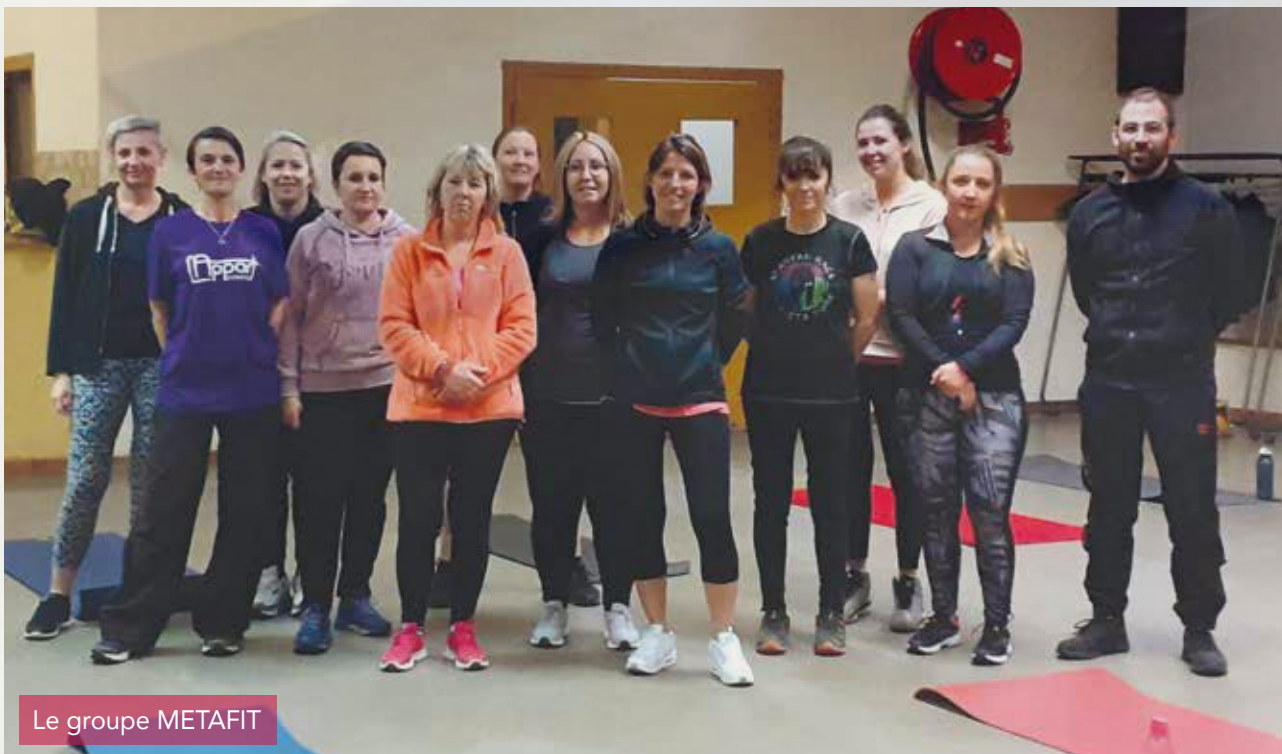
Le groupe METAFIT