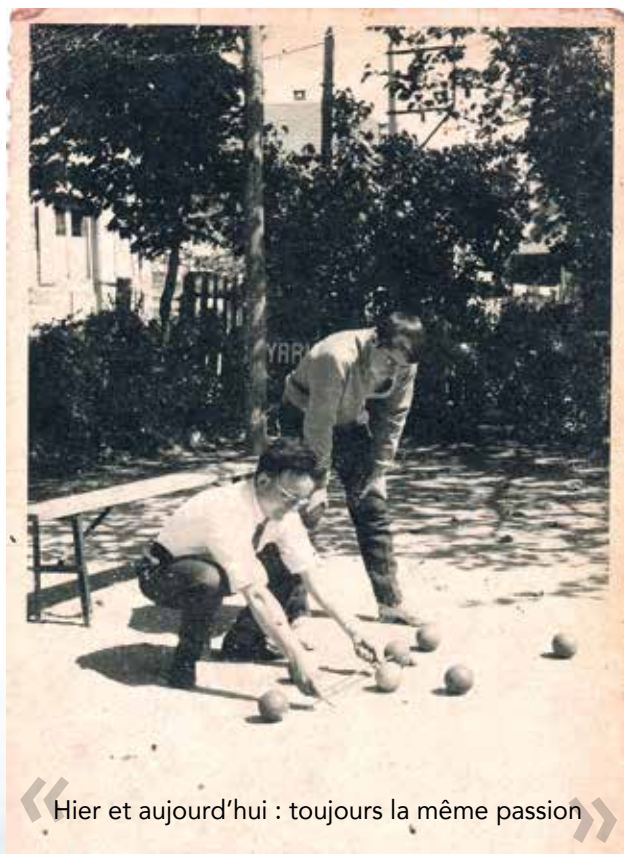
« Hier et aujourd'hui : toujours la même passion »