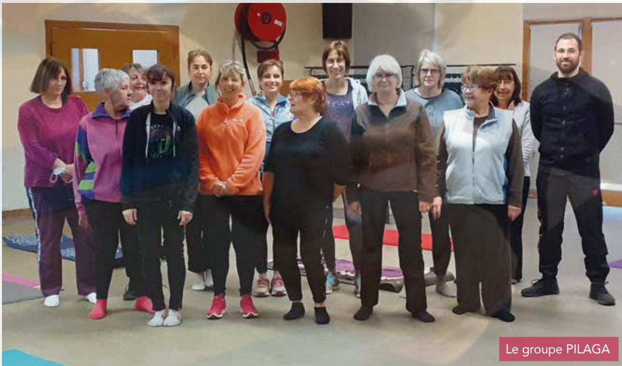
Le groupe PILAGA

La randonnée de début avril ne se fera pas non plus, cette année. L'ensemble du bureau espère vous retrouver en septembre pour établir un nouveau programme.