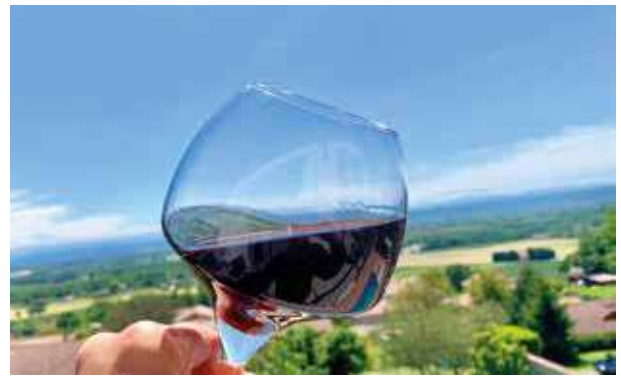
Restaurant Le Pix'L

L'ouverture du Restaurant Le Pix'L cet été 2021, a été un événement attendu par l'ensemble des Moissieurois et a connu un véritable succès. Accueil chaleureux en salle ou en terrasse et menus préparés aux petits oignons vous y attendent tous les jours, sauf le mercredi.